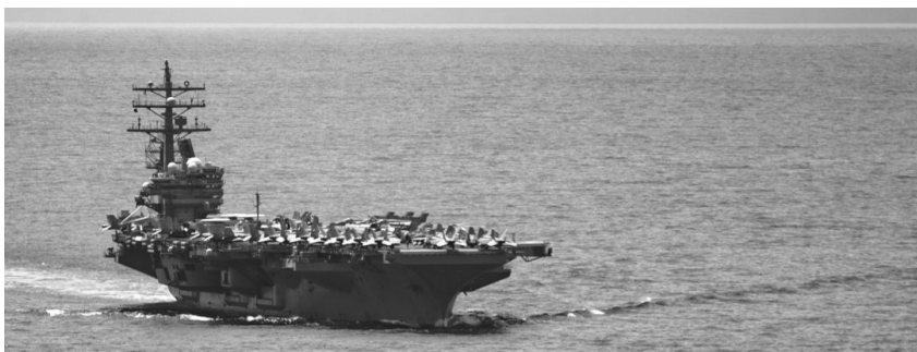
USS Ronald Reagan (CVN-76) habang bumabyahe sa Balabac Strait at patungo sa South China Sea noong Hulyo 12, 2022