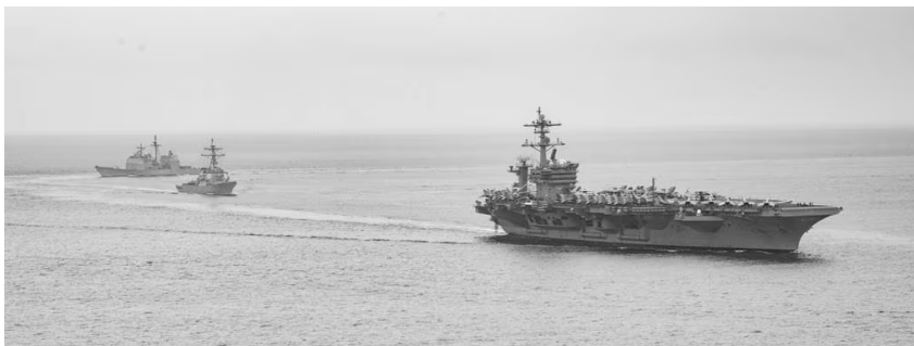
Carl Vinson aircraft carrier na nasa Pacific noong Hulyo 2021

Lumulutang na mga base militar ng US sa Asia na may lulang 7,000 tauhan at 90 sasakyang panghimpapawid: