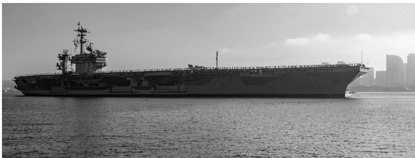
USS Abraham Lincoln (CVN 72), namumunong barko ng Abraham Lincoln Carrier Strike Group, noong Agosto 11, 2022 matapos ang pagpakat nito sa Indo-Pacific